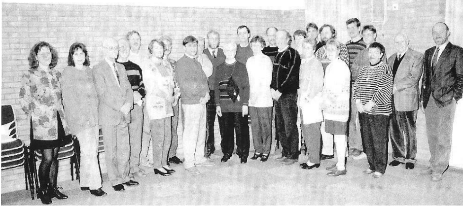
Kerkenraadsvergadering 1 november 1993

Totaal 180 pakketten worden samengesteld en verzonden.