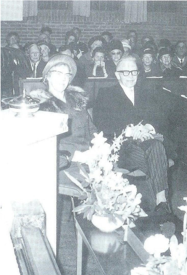
40 jarig Ambtsjubileum 14 maart 1966

In het verslag van “De Merwestreek” stond: De schaduwzijde van deze bijzondere bijeenkomst was dat deze “fijne” dominee in september met emeritaat gaat.