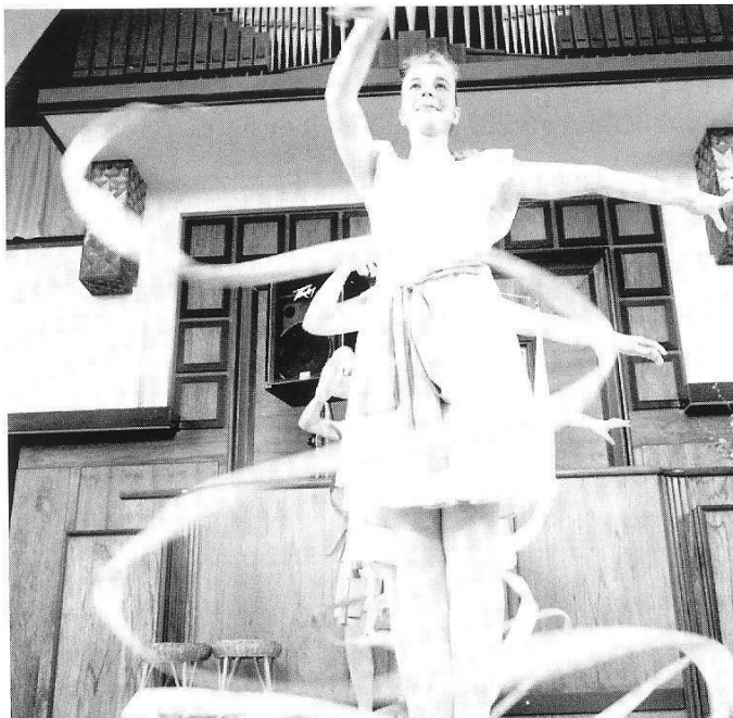
Gemeentezondag 23 februari 1992 met absolute "topper" de musical "Esther"

Wederom een Gemeentezondag met als absolute topper de opvoering in de kerkzaal van de musical "ESTHER". Op 3 april wordt deze musical nogmaals opgevoerd in een uitverkochte Bonkelaar.